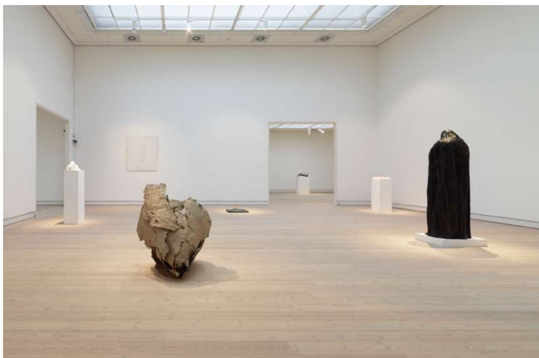
《Eine Gruppenausstellung》，霍爾森斯美術館，丹麥，2013 Eine Gruppenausstellung, Horsens Art Museum, Denmark, 2013