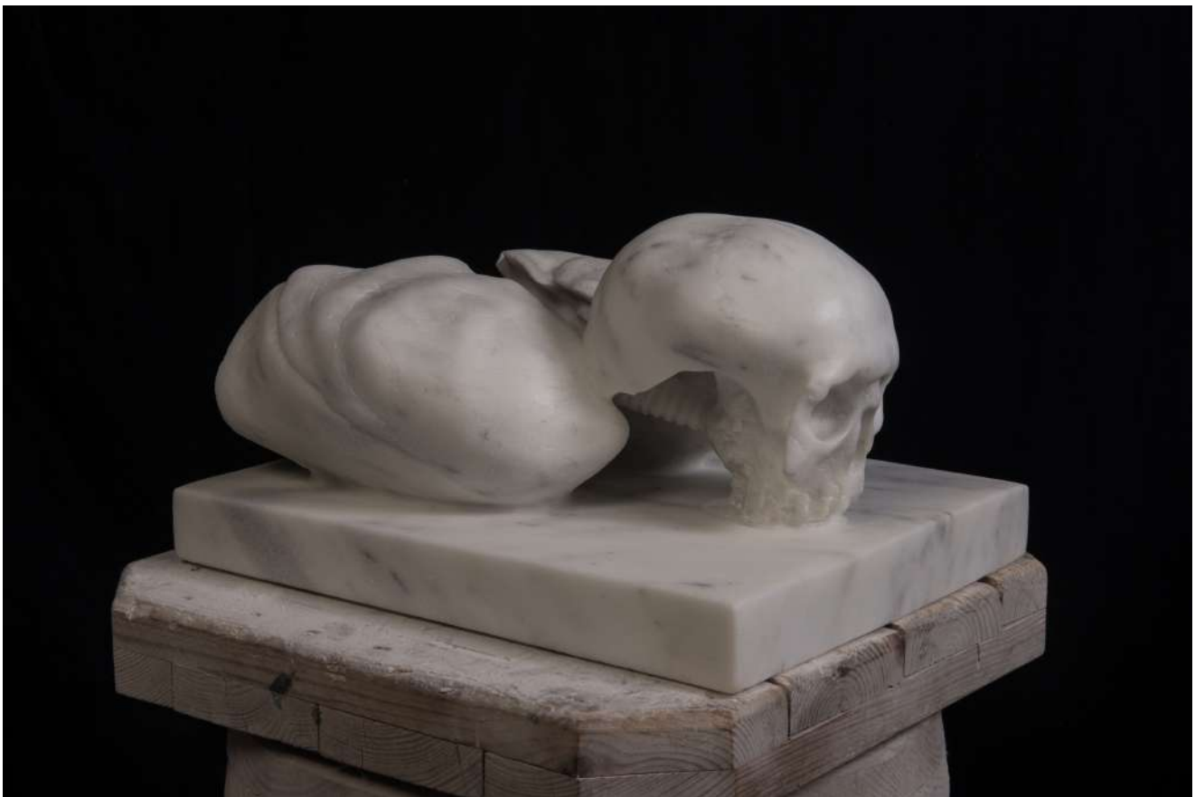
《聖靈》，雪花白大理石，29 x 40 x 35 cm，2015 - 2016 Santo Spirito , statuario marble, 29 x 40 x 35 cm, 2015 - 2016