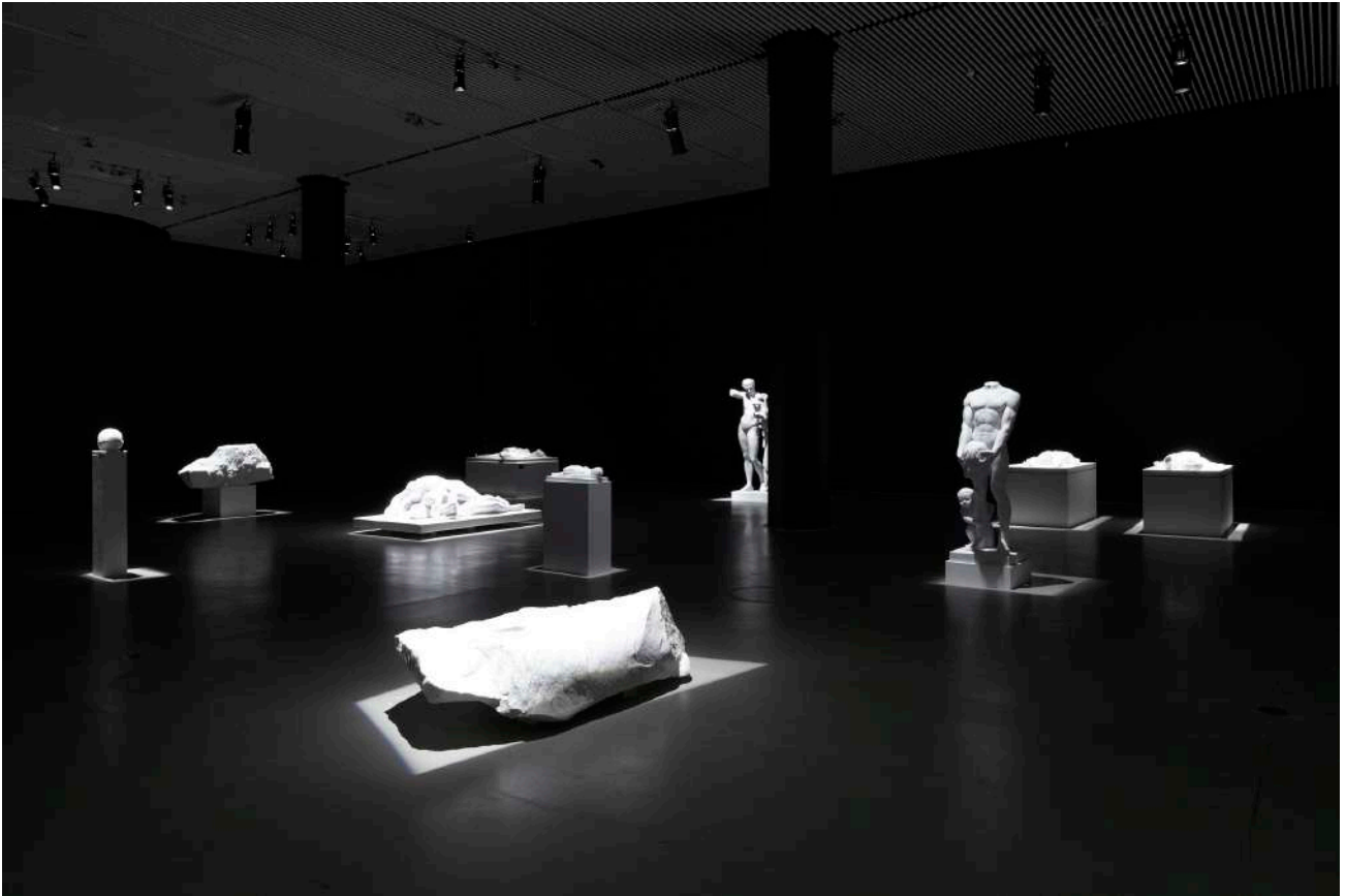
《Ghost》，奧胡斯美術館，丹麥，2010 Ghost , AROs Aarhus Art Museum, Denmark, 2010