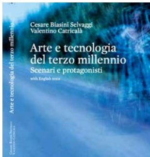
《第三个千年的艺术与技术》 塞萨尔·比亚西尼·塞尔瓦吉和瓦伦蒂诺·卡蒂亚尔(编辑) 法尔内西纳收藏出版, 2020

《沉浸在未来, 虚拟现实, 新一线电影与电视》 西蒙尼·阿卡尼(编辑) 意大利广播电视台-巴勒莫出版, 2020