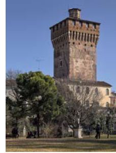
科波拉基金会 维琴察，意大利