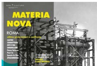
《新材料·罗马新一代比较》 马西莫·米尼尼(编辑) 曼弗雷迪出版, 2021