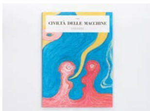
机器文明 拉卡尔穆托基金会, 2021