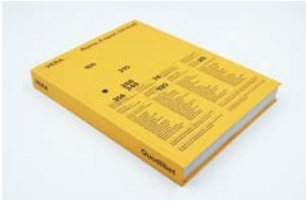
《VERA - Roma》，第8空间，54工作室 达米亚娜·莱奥尼(编辑) Quodlibet, 2021