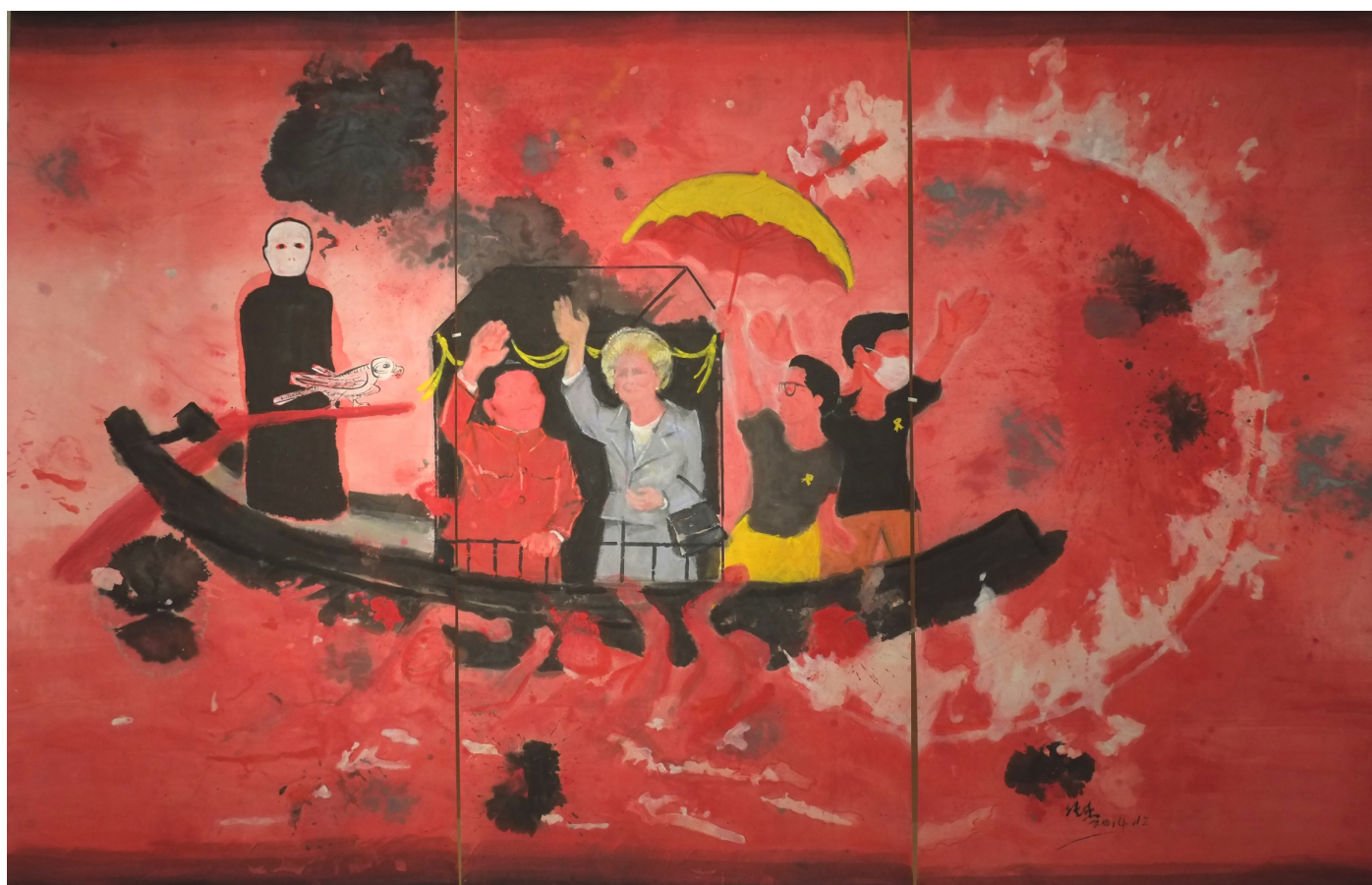
王純杰 | 《後 97 命運之船》 | 設色紙本 | 248 x 372 cm (三聯畫) | 2014 Wong Shun Kit, Post 97 Destiny Boat , colours on rice paper, 248 x 372 cm (triptych), 2014

展題取自於鄭國谷的《四臂幻化》，四臂觀音是藏傳佛教崇奉的重要神祇，具極其深厚殊勝的崇高地位。藏族人民深信，雪域之所以能夠得到教化，開創文明，和觀世音菩薩的化現有重要關聯。四臂觀音的唐卡構圖在藏傳佛教中各具深意，四臂分指「息、增、懷、誅」四佛行，備有平息苦痛、增加福報、救度眾生、消除惡念的寓意，出落成形象、體態、比例、手足姿勢皆有嚴謹的規範與象徵。鄭國谷疏理嚴密的色彩平衡、取其象徵意義的構圖，幻化出植根於宗教傳統，同時兼顧能量學、哲學、色彩論、陰陽定律的畫面。聖境、四臂觀音的動作姿態、甚至其背幔佛座經歷藝術家的配置，組合成目不暇給的視覺效果，帶來超脫俗世，提升心靈與身體素質的效果。《四臂幻化》此作亦為紐約現代藝術博物館 2019 春季大型鄭國谷個展的同系列作品，持續探索西方文化與數字技術與中國當代生活的關係。