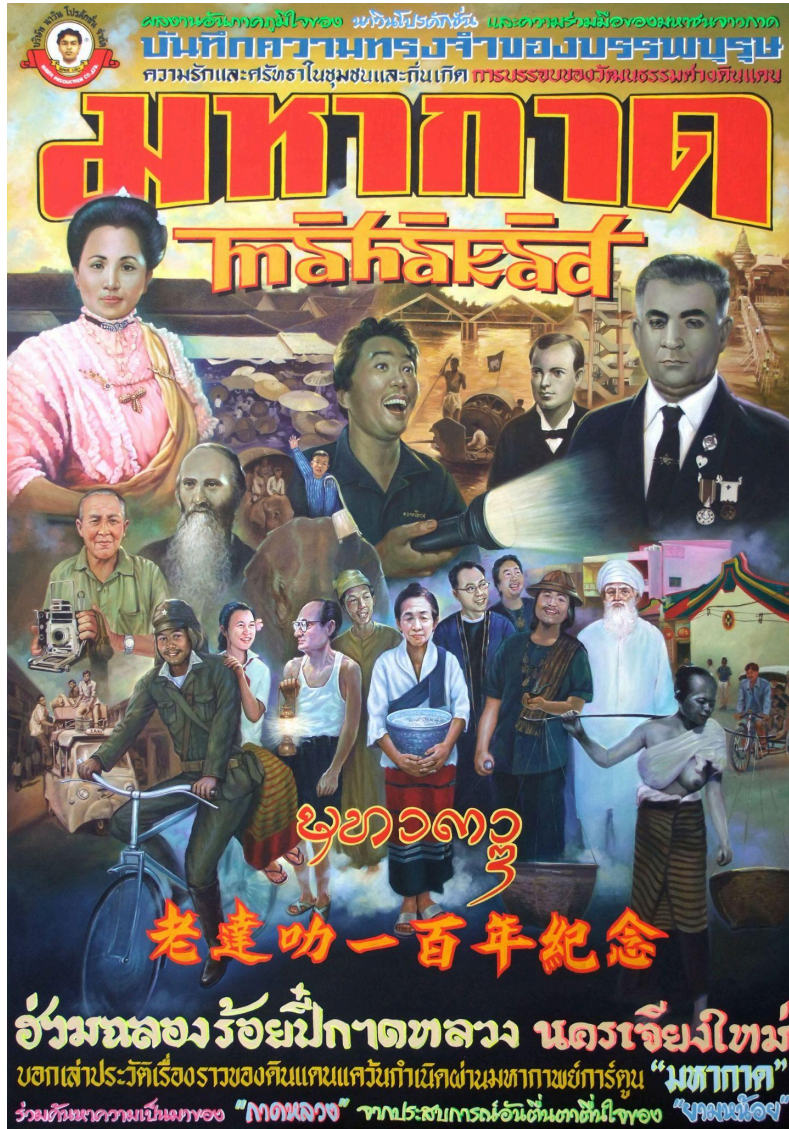
纳文·拉万柴库尔 |《Māhākād》|布面丙烯

包含项目记录和漫画书多本(含艺术家签名 | 105 x 150 cm | 2011