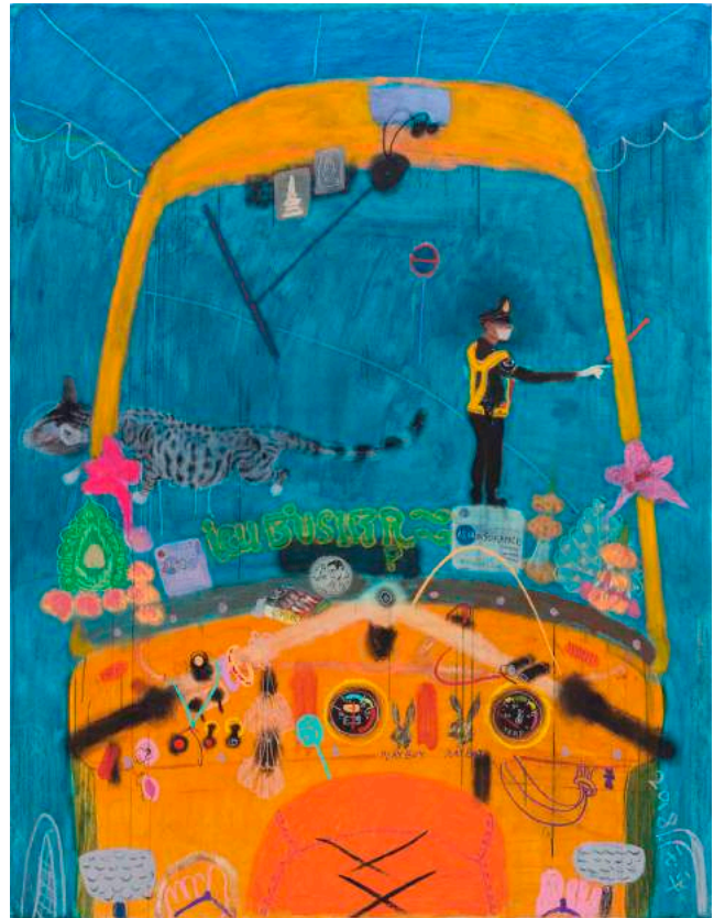
《嘟嘟 2》，布面塑彩及油畫棒，210 x 160 cm，2018 Tuk Tuk 2, Acrylic and oil pastel on canvas, 210 x 160 cm, 2018

王玉平選用布面丙烯、油畫棒及一些紙本來完成這次在泰國的創作。看似隨意，恬淡的畫面卻彷彿讓我們窺見表面之深處——形象存在於平面之中，而人的凝視卻總是深處，是記憶。