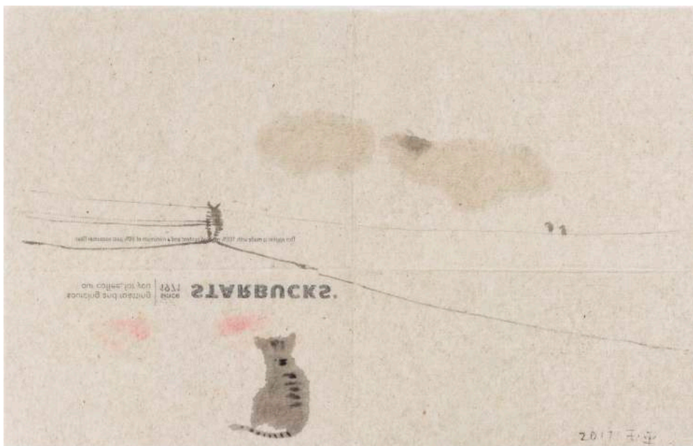
《星巴克 16》，紙本水彩，21.5 x 33.5 cm，2017 Starbucks 16, Watercolour on napkin, 21.5 x 33.5 cm, 2017

當代唐人藝術中心代理的中國著名藝術家包括艾未未、黃永砵、沈遠、王度、劉小東、楊詰蒼、夏小萬、孫原&彭禹、顏磊、王音、王玉平、陽江組、鄭國谷、林明弘、林一林、林輝華、何岸、趙趙、王郁洋、翁奮、楊勇、徐渠、徐小國、計洲、蔡磊、郭偉、凌健、陳文波等，也與裡克力·提拉瓦尼、阿運·拉挽猜哥、薩卡琳·克盧昂、邁克爾·查萊赫斯基等海外藝術家合作。