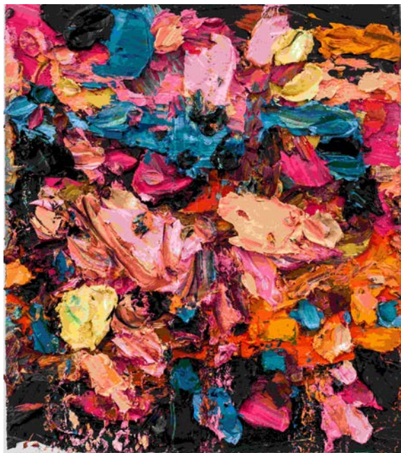
朱金石《无题四》，布面油画，180×160cm，2016

第二空间的《拒绝河流》则精选了朱金石近十年独领潮流的“厚绘画”，包括数件八十年代抽象绘画作品。朱金石从1980年完成第一幅抽象绘画到今天，风格历经变化，沉浮之间，厚积薄发，他的“厚绘画”于今独领潮流，作品迎面而来的力量，可以让我们体验到当代绘画的锋芒所在。相比他简约的装置艺术，朱金石在绘画上追寻了相反道路，丰富而眩目，紊乱而猛烈，桀骜不驯、咄咄逼人。他的绘画工具单一却与众不同，工作室保存着上百个沾满厚重颜料、十五公分宽的画笔和工匠涂墙抹刀，几百块替代画笔的调色板。